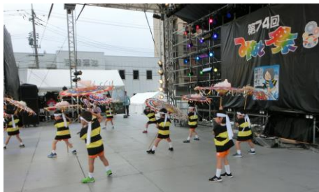
みなと祭りステージ出演