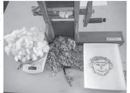
綿から種をくくり、選別しながら、手作業で綿毛を切り取ります。

私たち地域おこし協力隊員は、先人から受け継いだ「伯州綿」の品質と生産量の向上に取り組んでいます。市民の皆さまには、引き続き伯州綿へのご支援、ご協力をよろしくお願いします。