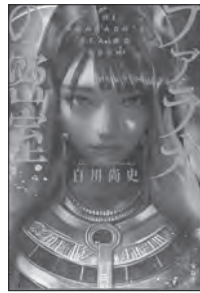
フロアオの密室 (白川尚史)