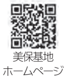
美保基地 ホームページ

また、陸・海上自衛隊や海上保安庁を含む多くの航空機による地上展示のほか、地元物産展など、さまざまな催し物を予定しております。 詳細はホームページをご覧ください。