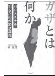
ガザとは何か (岡真理)