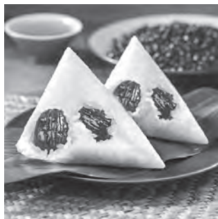
中国の「ナツメ入りちまき」