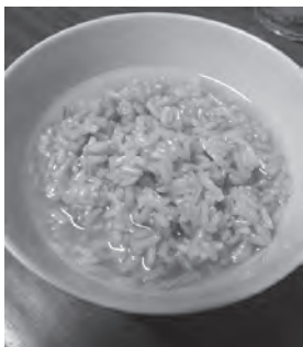
ベトナムの「ルオウ・ネップ」

そのほか、大きな川や湖が多い中国南部では「竜舟（ドラゴンボート）」の競争が盛んです。