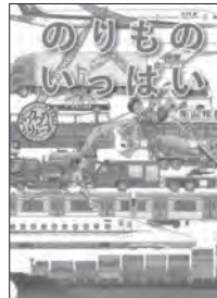
のりものいっぱい (青山邦彦)