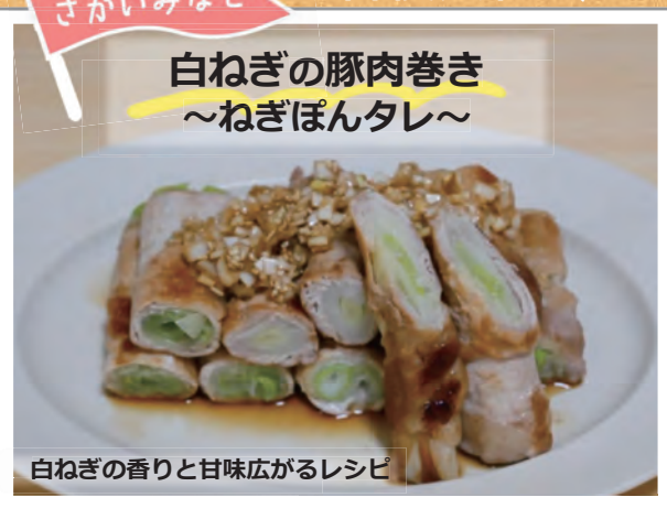
白ねぎの香りと甘味広がるレシピ