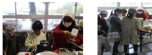
～お茶クラブの子どもたちの様子～