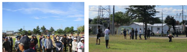
～三代目ふれあいグランドゴルフ大会の様子～

中浜小学校で、三代目ふれあいグランドゴルフ大会が開催され6年生が参加しました。参加された地域の方は「少し教えたら、すぐに上手になって、びっくりした」「とても良い交流ができた」と喜んでおられました。小学生は、「優しく教えてもらってわかりやすかった」と答えてくれました。