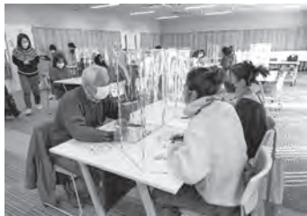
【グループ会話のテーマは「びっくりしたこと」】

日本語クラスが、同じ地域で生活する日本人と外国人が知り合うきっかけとなり、町で会ったときには声をかけ合い、いざという時に相談することができる関係を築くことで、お互いが安心して生活できる環境となることを願っています。