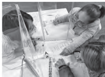
【ボランティアと一緒に問診票を書いてみよう】