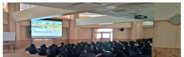
境二中、2年生の様子です。

境港警察署の方に主に自転車の乗り方についてお話を伺いました。車と自転車の事故の映像などを生徒は真剣に見て、話をよく聞いていました。