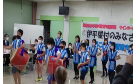
交流会当日の伊平屋村の児童の様子