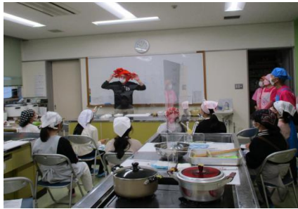
いただき、らかな和え、つみれ汁試食

1月14日沖縄伊平屋村の児童との交流を前に、境港市食生活改善推進員と市内の交流会参加の児童が郷土料理と紅ズワイ蟹の食べ方を学びました。交流会当日には保護者と食生活改善推進員で調理をしましたが、児童が作り方や、食べ方などを伊平屋村の児童に説明しました。二中校区の5,6年生の参加も多く学びの発表や、お礼の言葉などさすが高学年、大変よくできていました。蟹のむき方食べ方は、大人も大変参考になりました。