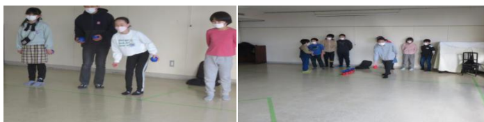
余子公民館での子どもたちのプレーの様子です。

子どもたちは、上達が早くルールをすぐに覚えて、ゲームを楽しんでいました。地域で行われる大会に出場したいという声がありました。