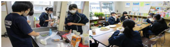
誠道公民館の様子です。美味しかったという声がたくさんきかれました。

出来立てのパンはふわふわで、中学生は2人分を、あっという間に食べていました。3月も第三水曜日に(内容は変わりますが)開催予定です。たくさんの方の、参加をお待ちしています。