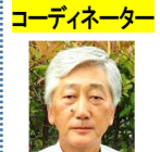
コーディネーター