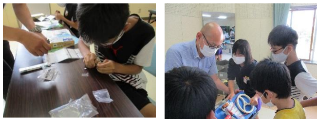
はまるーぷバスに乗って「海くら」へ行こう(外江公民館)