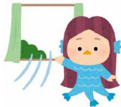
鳥取県内の感染状況

鳥取県内の新規感染者数も3月以降、横ばいの状態が続いており、いつ、どこで感染するか分からない状況です。マスクを正しく着用し、換気、手洗い、消毒など基本的な感染対策の徹底を継続してください。