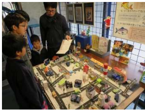
先輩作をリメイクした3D マップ