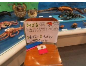
スタクイフィッシュ隊のクイズ