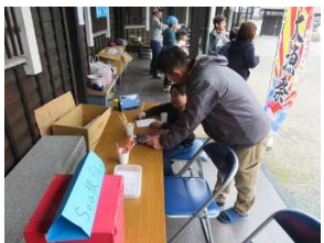
アンケートも学習には必須