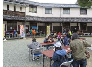
境港の新メニューは好評！