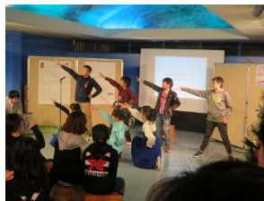
Sea ダンスチームの歌と踊り