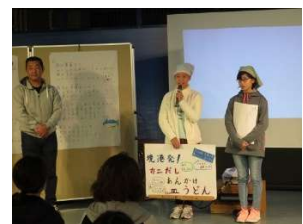
おいSea 級グルメチーム