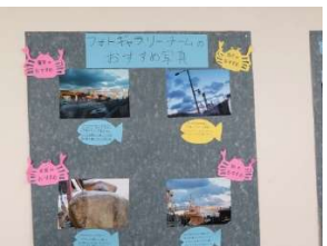
フォトギャラリーチームの作品