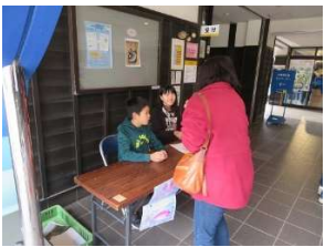
受付は笑顔が一番ですね！