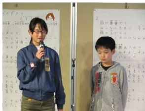
ちよっぴり緊張？開会式