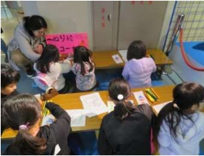
「お魚のぬり絵」コーナー