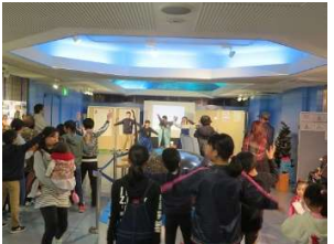
みんなで踊ったエンディング