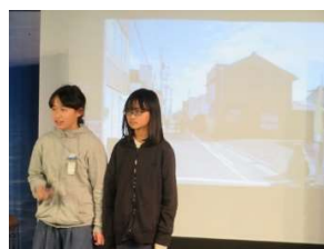
3D マップ&ガイドチーム