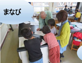
放課後学習会(上道小)