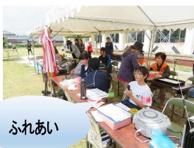
中学生アナ(境公民館)