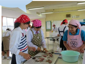
魚さばき実習(一中)