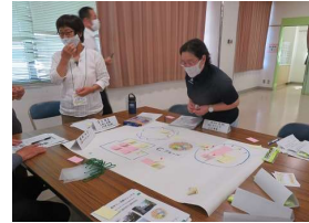
「いいねカード」を貼ります！