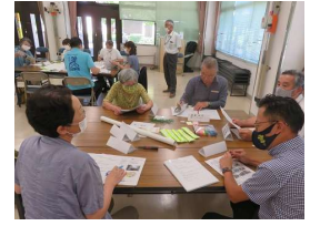
まずは「顔なじみ」ですね