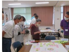
「なるほどねえ・・・」