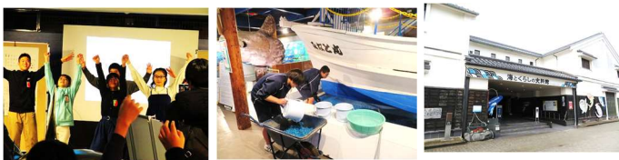
境小6年「ゆめっこ」2018.12 一中2年「職場体験」2019.5 海とくらしの史料館正面

昨年は「サメ展」で公民館を回り、多くの方に来て頂きました。中には当館に来られて多くの質問を頂いた方もありました。一中校区のサメ好きの皆様、また遊びに来て下さい。ホームページや市報の最後のページにイベント情報が載っています。4年度は自由研究に役立つ展示や鉄道の展示等の企画を準備しています。お見逃さないようご確認下さい。(話:大池 明館長)