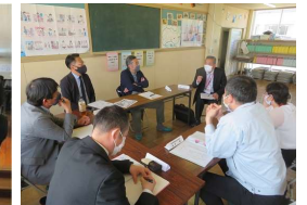
小グループでの協議