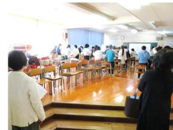
今回から授業参観も実施

3応援団がゆるやかに連携し、「地域学校協働活動」(地域各団体による子どものための活動)との連携を図ります。校長も応援団に所属します。会議を日中に開催し、授業参観を通して子どもたちの様子を知ります。