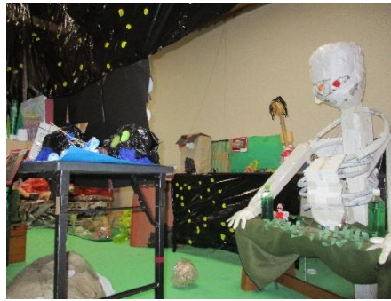
手作り妖怪倉庫が外江公民館に やってきた(育成保育園)