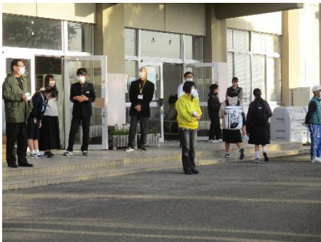
生徒、先生、地域と一緒に あいさつ運動(三中)