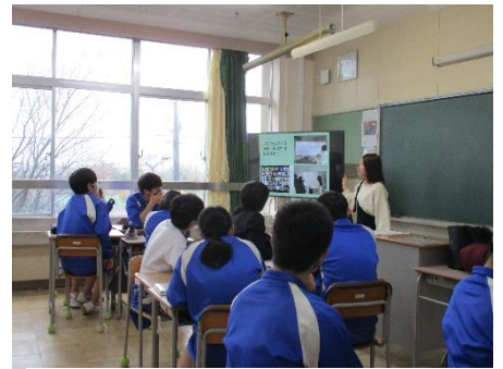
大学ってこんな所だよ～ 卒業生来校(三中)