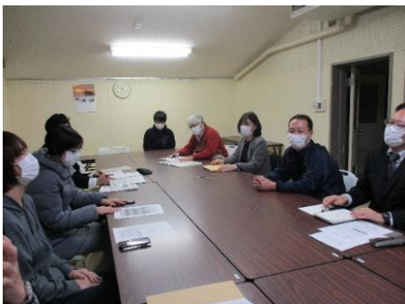
渡小・外江小・三中PTA合同三役会を行いました。