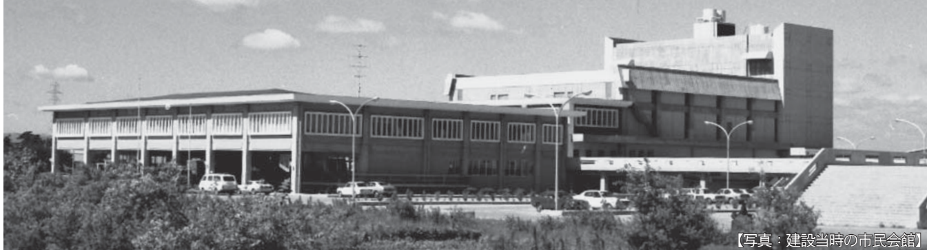
【写真：建設当時の市民会館】

昭和48年から本市の文化芸術の拠点として、また市民の交流の場でもあった境港市民会館を、境港市民交流センター（仮称）建設のため、4月30日（月・振休）をもって閉館します。