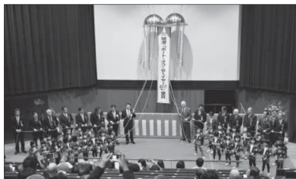
受賞記念報告会の様子

境港は、昨年、クルーズ客船の寄港が過去最高となる61回を数え、約6万7千人もの旅客が水木しげるロードや圏域の観光地を訪れたほか、おもてなしサポーターによる出港時の見送りや地元保育園へのクルーの訪問など、交流の機会が増えました。