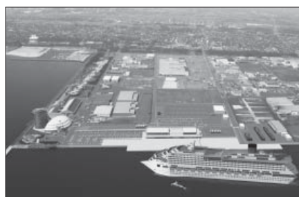
竹内南地区貨客船ターミナル(イメージ)