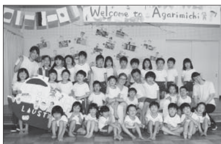
地元保育園へのクルーの訪問