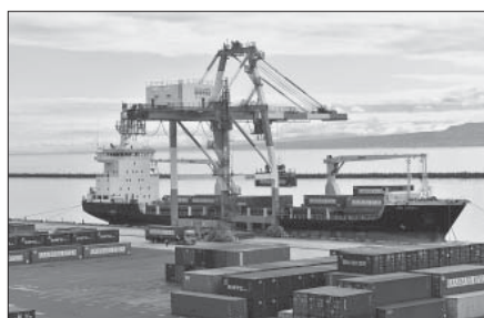
年々増加するコンテナ貨物

平成28年9月に供用開始となった中野地区の国際物流ターミナルに続き、現在、竹内南地区では、平成31年度内の完成をめざし貨客船ターミナルの整備が進められており、貨物、旅客のさらなる利用拡大と港湾を生かした地域の活性化が期待されています。