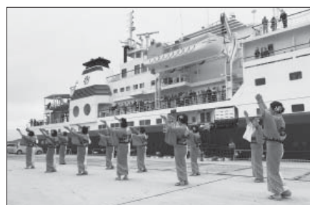
おもてなしサポーターによる見送り