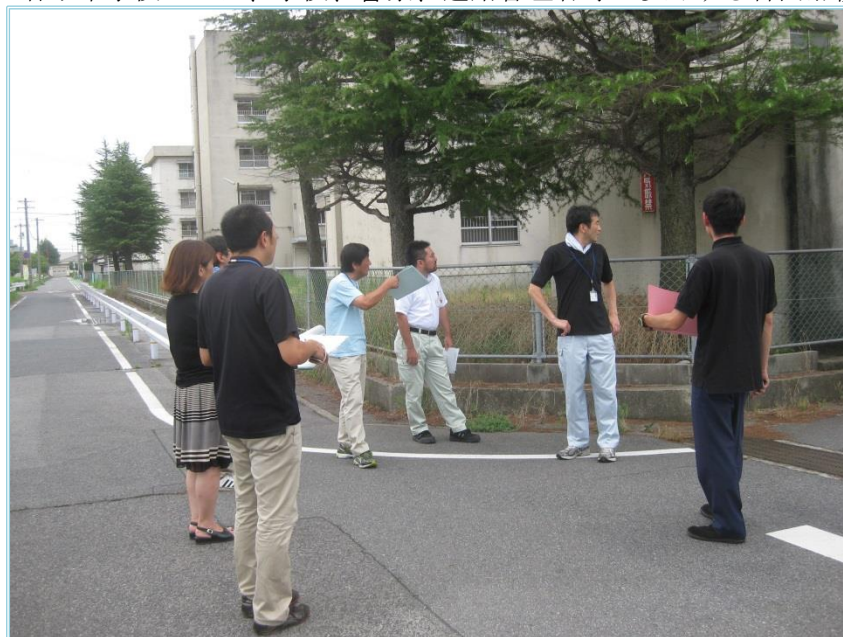
(平成26年度 合同点検実施状況)