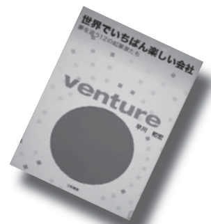
『世界で一番楽しい会社 一夢を追う12の起業家たち-』 早川和宏

不況の中、楽しさを原動力にして、大きな飛躍をとげている12の会社を紹介。企業の本来のあり方を考えさせる。