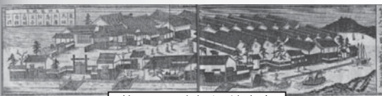
第82国立銀行 境支店

右の図は1845年(弘化2年)に作成された絵図で、幕末期の境港の様子がよくわかります。鉄山融通会所は境海峡に注ぐ「大正