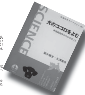
『犬のココロをよむ -伴行動物学からわかること-』 菊水健史・永澤美保

不況の中、楽しさを原動力にして、大きな飛躍をとげている12の会社を紹介。企業の本来のあり方を考えさせる。