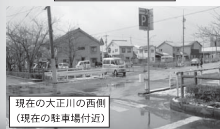
現在の大正川の西側 (現在の駐車場付近)

川」の西側に設置され、以後、為替会所や商法会所と改名を経て後1870年(明治3年)境町が誕生し、境市政管轄所の設置により商法会所も移管され、沿海事務も含め、同管轄所の管轄となりました。 その後、境市政管轄所は境市政所となり、「浜の目郡役所」や、連合戸長の自宅を役場とした時代の後、独立の役場を求める声が起こり、1885年(明治18年)大港神社の一角(西側)に境町役場が建設され、現在の境港市役所につながるのです。