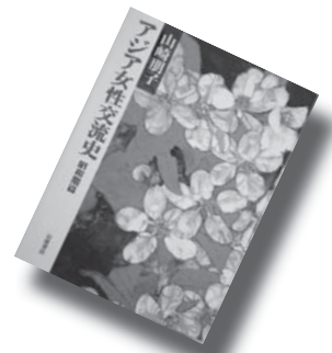
『アジア女性交流史 -昭和期篇-』 山崎朋子

(市民図書館 ☎47-1099 ホームページアドレス http://lib.city.sakaiminato.tottori.jp/ )