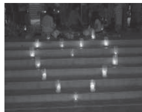
昨年のキャンドルナイトの様子