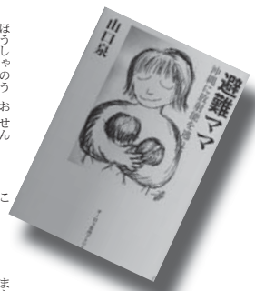
『避難ママ』 山口 泉

クモの巣の形からクモの種類がわかる。クモのふしぎ、巣や糸などのひみつも公開。大人も子どもも、この夏はとりこに。