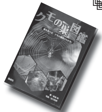
『クモの巣図鑑』 新海 明

クモの巣の形からクモの種類がわかる。クモのふしぎ、巣や糸などのひみつも公開。大人も子どもも、この夏はとりこに。