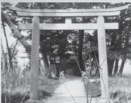
廣見神社(昭和初期)