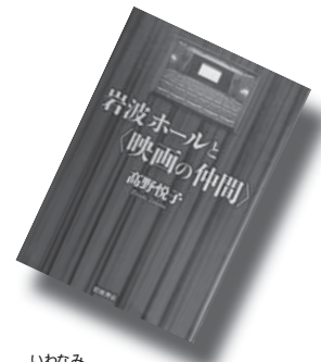
『岩波ホールと映画の仲間』 高野 悦子

(市民図書館 ☎47-1099 ホームページアドレス http://lib.city.sakaiminato.tottori.jp/ )