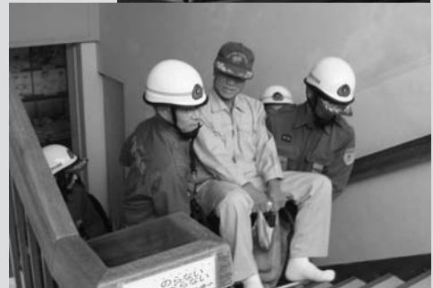
昨年11月の津波避難訓練