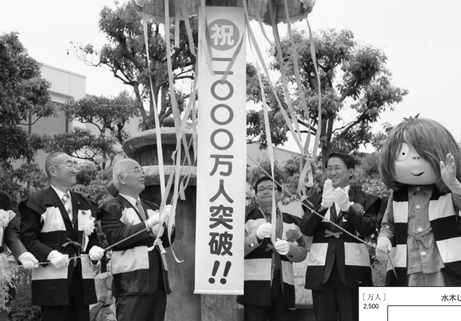
記念のくす玉割り（河童の泉）

これを記念し、5月20日（日）に河童の泉（大正町）で関係者や観光客らが集まり、くす玉割りや2千個の紅白餅まきを行い、2000万人達成を祝いました。