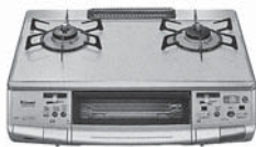
卓上ガスストップ コンロ(魚焼きオート) ハオS660VGAS