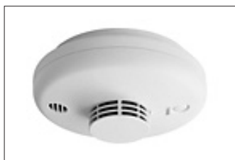
天井取付式警報器