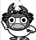
中海市長会 キャラクター うんぱくん