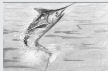
最優秀賞：今 郁乃 「カジキマグロ」