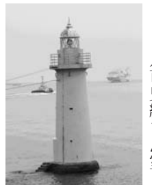
境港防波堤灯台と初就航時の定期貨客船

「文化財を活用しながら保存する」という発想から生まれた国の文化財登録制度により、鳥取県は平成九年度から郷土の歴史を語る身近な建造物を調査してきました。この調査により、鳥取県の近代化を支えた文化遺産として、境港市の一つに境港防波堤灯台を紹介しています。釣人から「白灯台」と呼ばれ親しまれている「境港防波堤灯台」は、大正十一年から始まった境港湾修築事業で防波堤灯台とともに設置され、昭和六年四月一日初点灯されています。古くから「伝馬いらずの良港」として知られる山陰随一の境港は、鳥取藩の御廻米所など役所の設置を得て、港湾や海運の振興発展の基礎が出来ました。明治以降、境港は貨客船の就航が盛んになり京阪神や大陸間貿易として躍進してきました。◆明治一六年全国主要港湾指定 ◆二三年県費支弁港指定 ◆二九年開港外貿易港指定 ◆四十年全国重要港湾指定 ◆大正元年全国第二種港指定