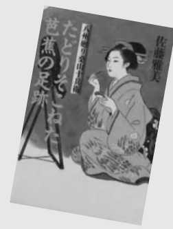
『たどりそこねた』 芭蕉の足跡 佐藤雅美

十兵衛シリーズで8話の短編。表題は「奥の細道」をたどる観光気分の旅が思わぬ物になる。古い地名満載。