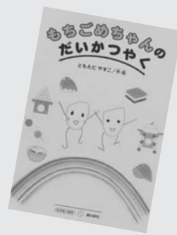
『もちごめちゃんのだいかつやく』 ともえだやすこ