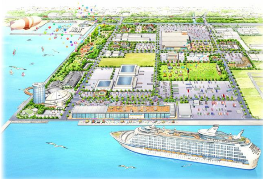
「竹内南地区整備イメージ図」