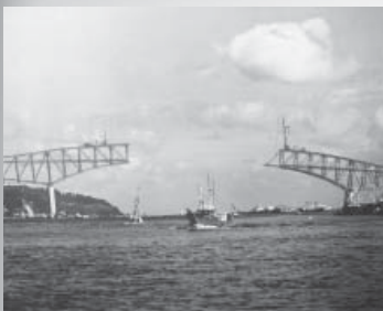
建設中の境水道大橋 (昭和46年)

児童文学の第一人者である 筆者が、本の楽しみを分かち 合うための神髄を惜しみなく 披露する。