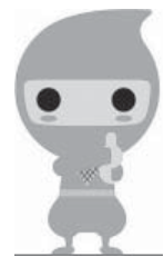
コソダテカクニンジャ

平成26年度に引き続き、消費税率引き上げの影響等を踏まえ、子育て世帯に対して、臨時特例的な給付措置として、今年度も子育て世帯臨時特例給付金が支給されます。 支給対象となる人は、忘れずに申請してください。