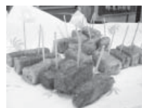
前回(平成25年)の様子