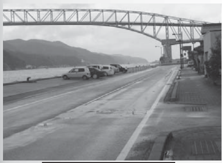
花町棧橋架設付近 (現在)