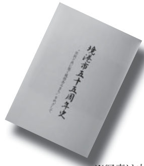
※写真は中表紙 『境港市五十五周年史』 境港市

平成13年度から10年間の行政史であるが、読み物としても面白く貴重な文獻。台湾の変遷、戦災都市境港、伝統産業など。