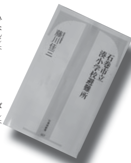
『石巻市立湊小学校避難所』 藤川 佳三

バンダラデシユとノルウエーの遠く離れた2人の少女は一枚のTシャツで繋がっていた。安くものが買えることの意味。