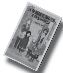
『人を捨てない国、スウェーデン』 三瓶 恵子

スウェーデンに住み始めて30年。とても面白く不思議な国です。いまだに「あれっ!」と驚かされることも多いです。