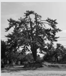
台場公園内の連理の松

根元から約1mのところを二股に分かれている巨木で、幹の太さ、樹姿は②と類似していることから、明治28年、境港灯台が設けられた際に植えられたうちの1本ではないかと考えられています。