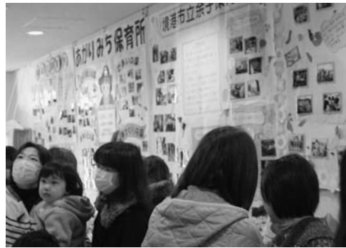
食育の取り組みに興味深そうに見る参加者

2009年に山陰女性初の野菜ソムリエの中級資格「ベジタブル&フルーツマイスター」を取得。県内各地で講演活動や料理教室講師など野菜・果物の魅力発信の活動を行っている。