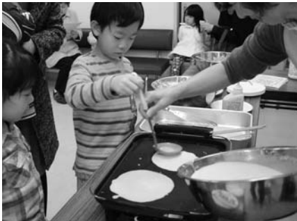
米粉の野菜クレープ作りを体験