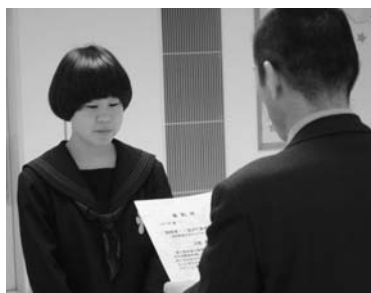
おすすめ野菜料理の表彰式