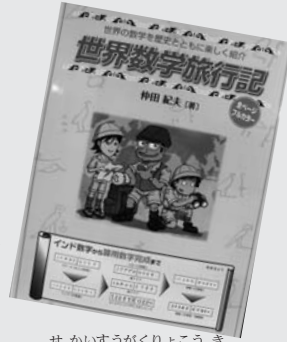
『世界数学旅行記』 一世界の数学を歴史とともに楽しく紹介！ 仲田紀夫

どんな地域・民族からどんな数字が生み、発展・伝播したか。筆者が世界各地を实地探訪し興味深い話を易しく紹介。