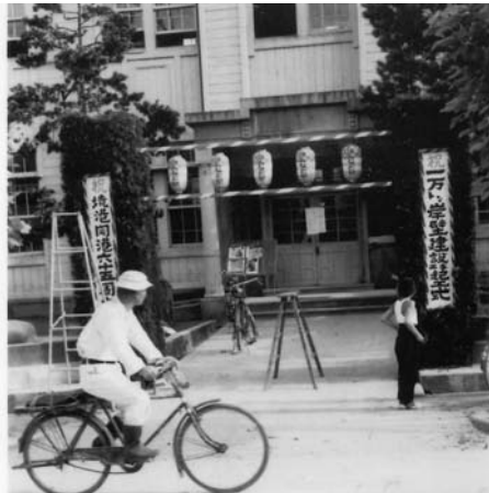
昭和35年当時の旧市庁舎(元町)

また、「みなと祭」も観光協会主催となり、進捗する市政発展に花を添える事業となつていきます。門の前に立つ子どもたちの姿勢に、何が起るのだろうかという期待感が感じられます。 (市史編さん室 小瀬浩)