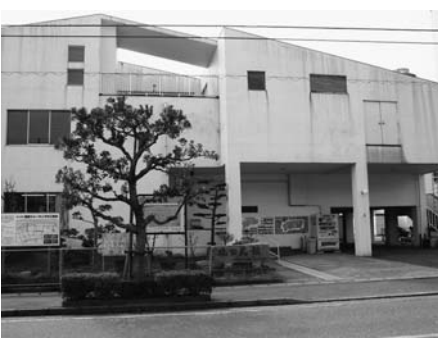
境公民館が建つ現在の同所を撮影

ランニングシャツの子どもと、自転車に乗る白いシャツ姿の人の視線の先に、「みなと祭」の提灯と、境港開港65周年記念と1万トン岸壁建設工事起工式の飾りつけの終わった看板。 ここは旧市庁舎正面玄関です。残っている脚立で、祝典の慌ただしい設営の様子が伝わってきます。