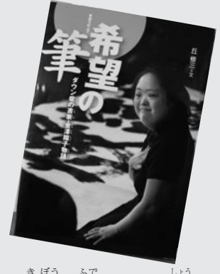
『希望の筆-ダウン症の』 書家・金澤翔子物語 丘 修三

NHK大河ドラマ「平清盛」の題字揮毫者で、ダウンスの書家・金澤翔子物語。無欲と無垢の純粋さが人の心をうつ。