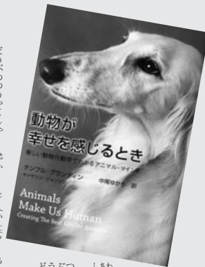
『動物が幸せを感じるとき』 テンプル・グランディン

動物通訳者で自ら自閉症の著者が動物を通して動物の行動原因を探り、動物と人間の共生関係を提示する。動物と人間の新しい関係を探る。動物通訳者で自ら自閉症の著者が動物を通して動物の行動原因を探り、動物と人間の共生関係を提示する。動物と人間の新しい関係を探る。