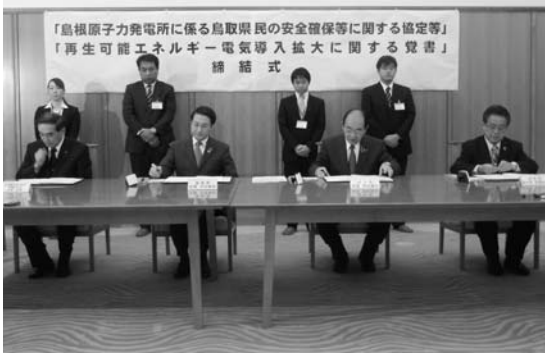
知事公邸で行われた調印式の様子

島根原子力発電所に係る周辺地域住民の安全確保および環境の保全を図ることを目的として、昨年7月から鳥取県、境港市、米子市および中国電力の4者で、安全協定の締結に向け協議してきました。この協議での合意により、「島根原子力発電所に係る鳥取県民の安全確保等に関する協定及び運営要綱」を、10キロ圏外では全国で初めて、昨年12月25日に4者で締結しました。