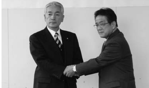
市と警察署の協定調印式