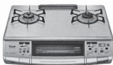
卓上ガスストーブ コンロ(魚焼きオート) ハオS660VGAS