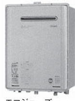
エコジョーズ (オートタイプ) RUF-E2400SAW