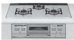
ビルトインパールクリスタル コンロ(魚焼きオート) RS78W7K12R-V