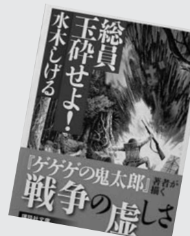
『総員玉砕せよ！』 水木しげる

誰れに看取られることもなく死に、忘れられていった若者たちの物語。著者の最も愛着深いラバウル体験戦記もの。