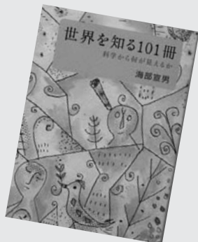
『世界を知る101冊—科学から何が見えるか—』 海部宣男

物語大英博物館 レーベンフックの手紙、古文書返却の旅等、101冊の自然科学、現代人必読知的面白本紹介。