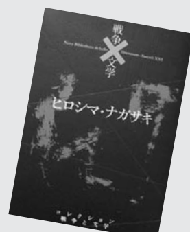
『ヒロシマ・ナガサキ—コレクション 戦争と文学—』 原民喜ほか