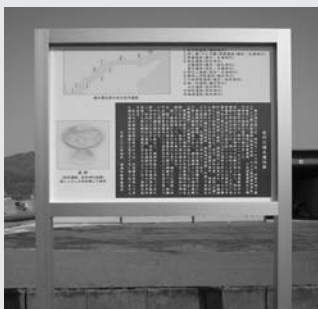
境水道沿岸古代遺跡説明板 (西灘神社境内に設置)