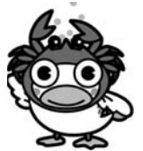
中海圏域イメージキャラクター「ウンパくん」