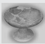
たかつき 高杯 やのしり の尻遺跡(矢)

窟に住み、西灘や北灘を前進基 地として漁業を中心に暮らして いたものと考えられます。 市では、このような先人の歩 みを知っていたため、境水 道沿岸の古代遺跡について記し た説明板を外江町、西灘神社境 内に設置しました。また、市内 で出土した土器の一部は「海と くらしの史料館」で展示して おりますので、ぜひご覧ください。 ● 問合せ先 生涯学習課文化体育係 (☎47-1093)