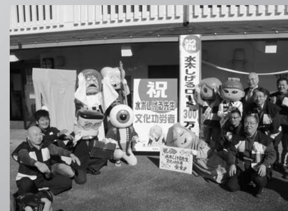
10月に水木しげるさんが文化功労者に選出される。ドラマ放映終了後も水木しげるロードの客足は衰えず300万人を突破。ダブルの吉報で11月4日に式典を開催し祝いました。