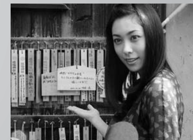
映画「ゲゲゲの女房」の主演吹石一恵さんが妖怪神社でヒット祈願。