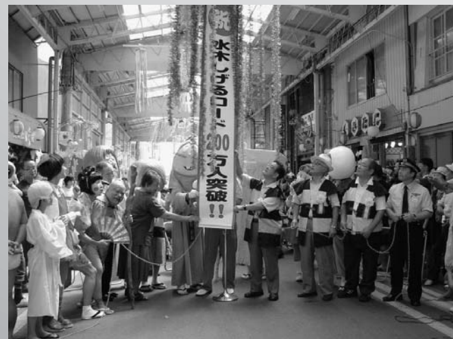
ドラマが盛り上がるにつれて水木しげるロードの入込客もうなぎのぼり。年間入込客数が過去最高記録を突破し、8月29日には記念セレモニーを開催。