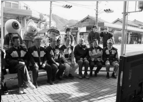
3月29日松下奈緒さん主演のドラマ「ゲゲゲの女房」が放映開始。熱い1年の始まり。