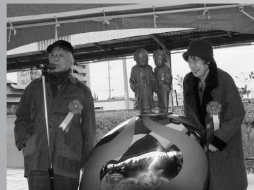
3月8日「ゲゲゲの女房」のドラマ化を記念して水木夫妻のブロンズ像が設置される。