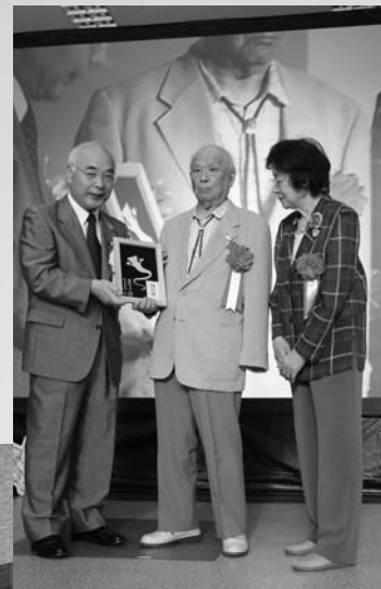
4月に米子空港の愛称が「米子鬼太郎空港」に決定し、7月24日には記念式典を開催。世界初の妖怪の名前がついた空港の誕生。