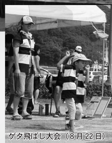
ゲタ飛ばし大会 (8月22日)