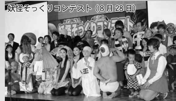
妖怪そっくりコンテスト (8月28日)