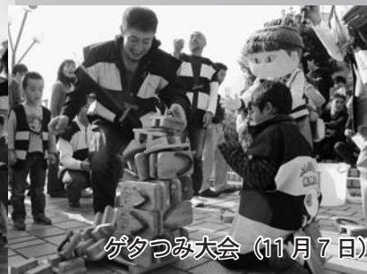
ゲタつみ大会 (11月7日)