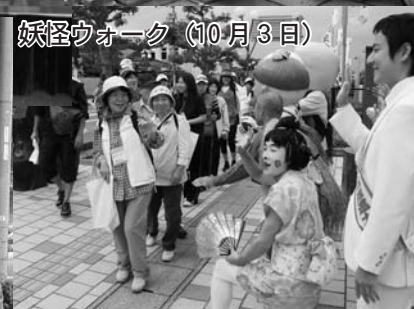
妖怪ウォーク (10月3日)