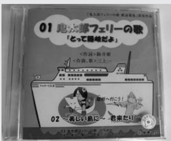
鬼太郎フェリーの歌 (好評発売中!!)

実行委員会では武良郷にブロンズ像「踊る水木しげる先生」像を建立。その後、西ノ島の「焼火権現」、境港の「隠岐へ向かう鬼太郎親子と水木先生」、島後の「河童」「琵琶ぼくばく」「五体面」など十体のブロンズ像が完成し、さらに西郷港には「出た！鬼太郎親子とねずみ男」の妖怪オブジェも登場しました。その他、隠岐の港には「妖怪巨大画」もあり、水木しげるロード延長プロジェクトは更なる広がりを見せています。 皆さんも境港から延長した「水木しげるロード」を見に鬼太郎フェリーに乗って、隠岐まで足を伸ばしてみませんか？