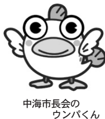
中海市長会の ウンバくん

市報11月号で紹介した「中海圏域の定住自立圏の形成に関する協定」に基づく、4市1町（境港市・米子市・松江市・安来市・東出雲町）の連携した取組みに対し、国から中心市である米子市、松江市に「地域活性化・経済危機対策臨時交付金」約230百万円が今年度、割増交付されることになりました。