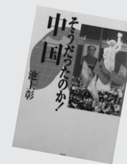
『そうだったのか! 中国』 池上彰

高校生以上。ブラジル移住が始まってちょうど百年となる。日本の、そして鳥取県民の移住史の集大成。 角護画集(角護) ◆夕陽の梨(仁木英之) ◆六道湖・中海と霞が浦(浅野敏久) ◆鬼太郎と行く 妖怪道五十三次(水木しげる) ◆ハワード・エンド(E・M・フォスター) ◆とつとり民俗文化論(坂田友宏) ◆のんびり山陰本線で行こう(野村正樹) ◆出雲国名所歌集(芦田耕一) ◆山魔の如き唾うもの(三津田信三) ◆狐火の家(貴志祐介) ほか計354冊