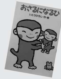
『おさるになるひ』 いとうひろし

小学校・中学校から中学生。総合学習用。心・体・命の働き、大切さについてイラストや写真で詳解する3巻。