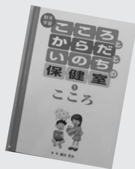
『こころとからだの保健室』 細谷亮太

高校生以上。13人の作家による、ミッドナイトを舞台にした短編集。電子書籍配信サイトから加筆・修正したもの。